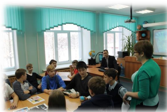
Встреча с профессионалом