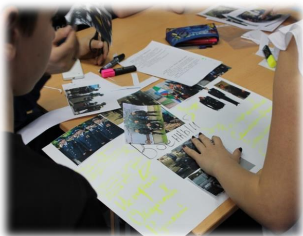
Защита модели профессионала