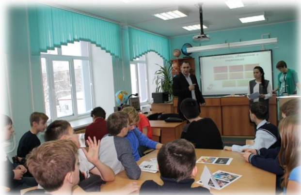
Создаем модель профессионала