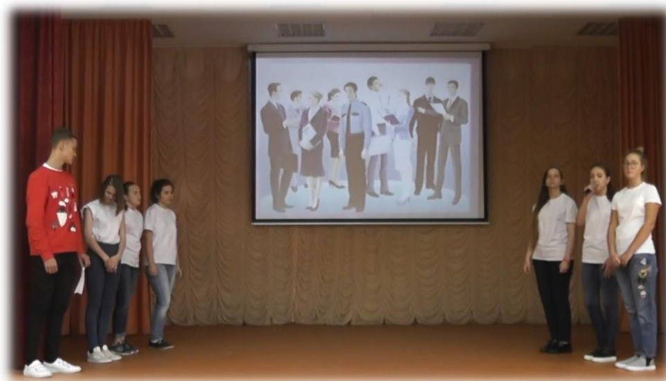
Разминка «Назови профессию»