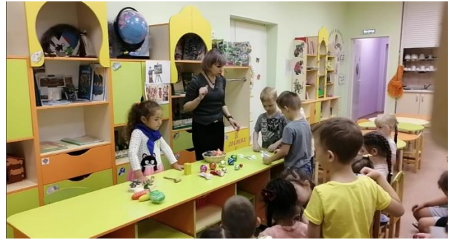
Дидактическая игра «Найди деньги России»