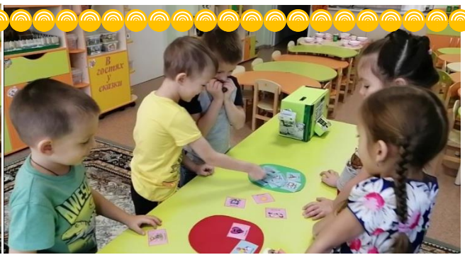
Конструирование и обыгрывание постройки «Банк нашего города»