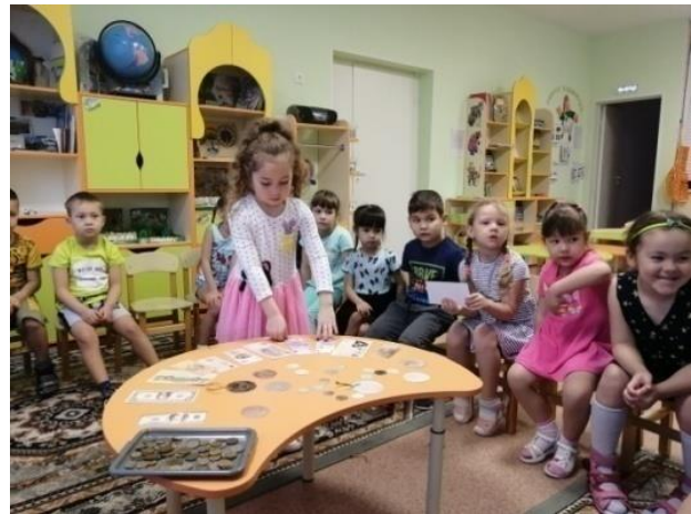
НОД «Семейный бюджет семьи Барбоскиных»