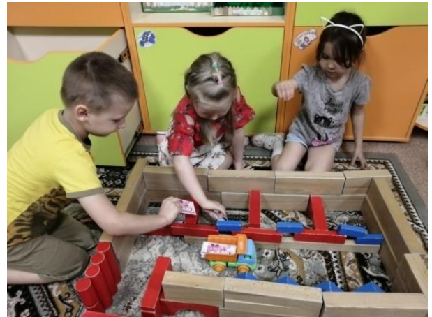
Сюжетно – ролевая игра «Банк»