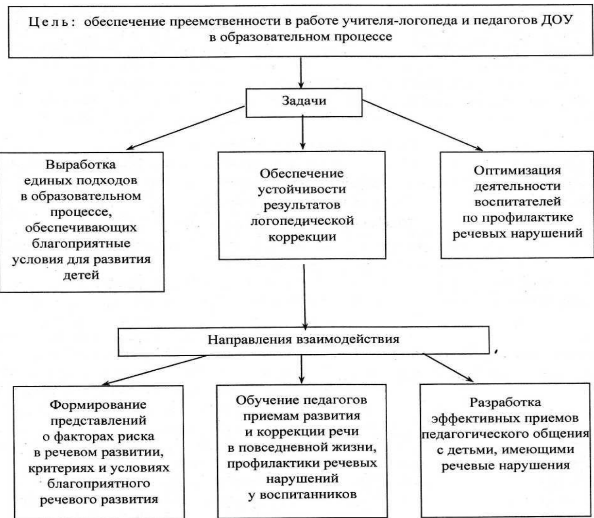
Совместная деятельность учителя-логопеда и воспитателя